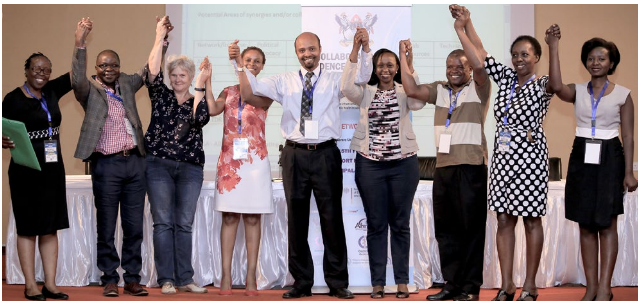
Clôture de la première réunion annuelle de réseautage CEBHA+, 2018, Kampala, Ouganda